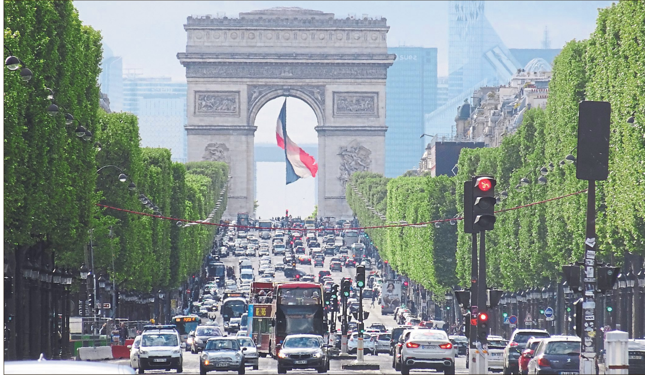
Wer mit dem Auto in Frankreich oder anderen Ländern unterwegs ist, sollte darauf achten, dass die Grüne Versicherungskarte noch gültig ist.

Theoretisch muss man das Dokument nicht immer mitnehmen. In vielen Ländern, darunter auch die Schweiz, Großbritannien und Mon-