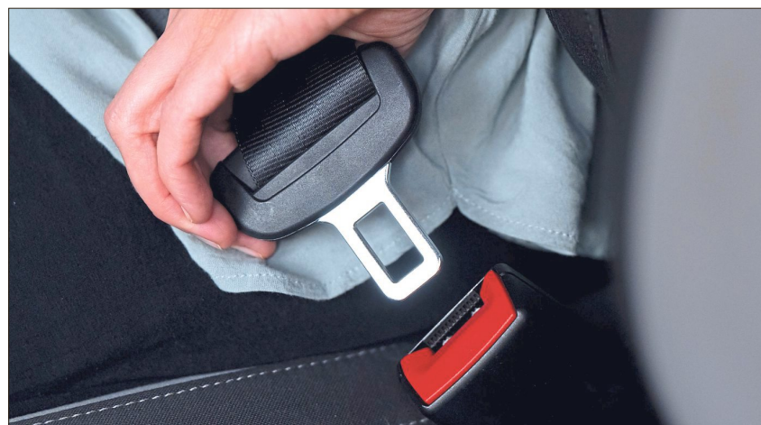
Anschnallen ist heute ganz selbstverständlich. Und nur in wenigen Fällen gibt es in Deutschland eine Ausnahme von der Gurtpflicht.