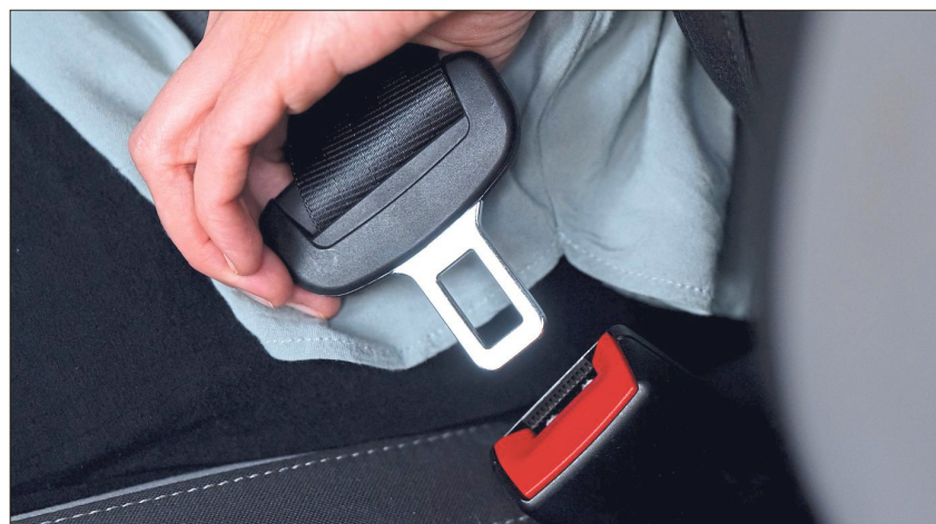
Anschnallen ist heute ganz selbstverständlich. Und nur in wenigen Fällen gibt es in Deutschland eine Ausnahme von der Gurtpflicht.