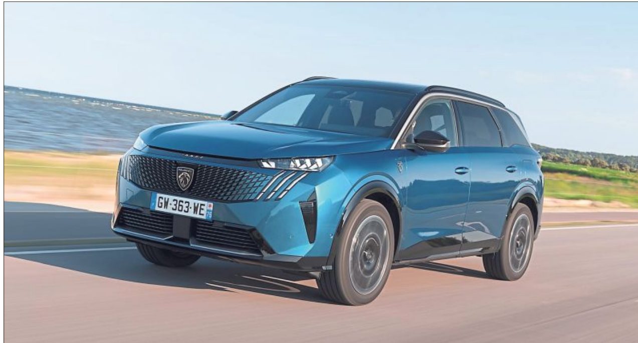
Kraftvoll und dennoch familienfreundlich: Der Peugeot 5008 Hybrid kombiniert markantes SUV-Design mit effizienter Mildhybrid-Technik.

Der 48-Volt-Mildhybrid als kleiner Bruder des Plug-in muss sich im Spektrum der zwei Welten mit einem galaktischen Schattenplätzchen begnügen – so auch im getesteten Peugeot 5008 Hybrid. Vollelektrisch vom Hof rollen, einer Ampelkreuzung lautlos entgegensehnen, nach ertragreicher Rekuperation durch eine Tempo-30-Zone schnurren und dadurch sachte den Verbrauch des großen Bruders, des Verbrenners, minimieren – zu mehr ist ein Schmalspur-Doppelherz technisch nicht fähig. Muss er auch nicht, denn das mit fossilem Kraftstoff gespeiste Aggregat im Top-SUV der Löwenmarke kompensiert die Schmalbrüstigkeit des Elektro-Adlatus leicht – obwohl der Siebensitzer mit kantiger Kubatur von lediglich 100 Kilowatt/136 PS befeu-