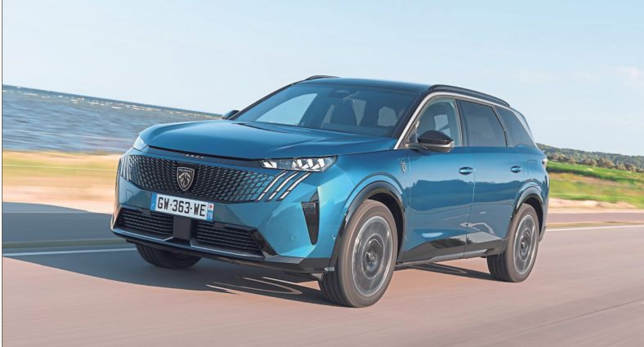
Kraftvoll und dennoch familienfreundlich: Der Peugeot 5008 Hybrid kombiniert markantes SUV-Design mit effizienter Mildhybrid-Technik.

Der 48-Volt-Mildhybrid als kleiner Bruder des Plug-in muss sich im Spektrum der zwei Welten mit einem galaktischen Schattenplätzchen begnügen – so auch im getesteten Peugeot 5008 Hybrid. Vollelektrisch vom Hof rollen, einer Ampelkreuzung lautlos entgegensegeln, nach ertragreicher Rekuperation durch eine Tempo-30-Zone schnurren und dadurch sachte den Verbrauch des großen Bruders, des Verbrenners, minimieren – zu mehr ist ein Schmalspur-Doppelherz technisch nicht fähig. Muss er auch nicht, denn das mit fossilem Kraftstoff gespeiste Aggregat im Top-SUV der Löwenmarke kompensiert die Schmalbrüstigkeit des Elektro-Adlatus leicht – obwohl der Siebensitzer mit kantiger Kubatur von lediglich 100 Kilowatt/136 PS befeu-