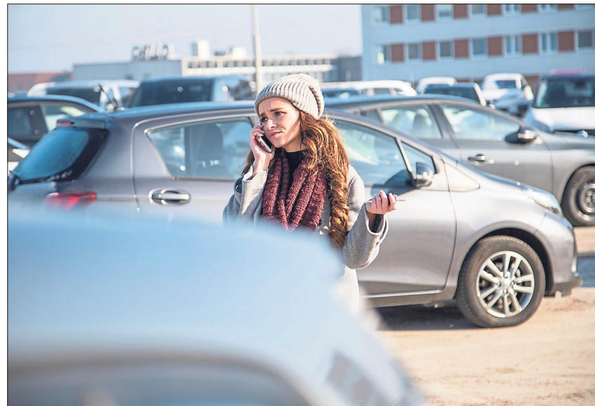
Leere Parklücke: Wenn das Auto gestohlen wurde, müssen Betroffene das umgehend der Polizei und ihrer Versicherung melden.