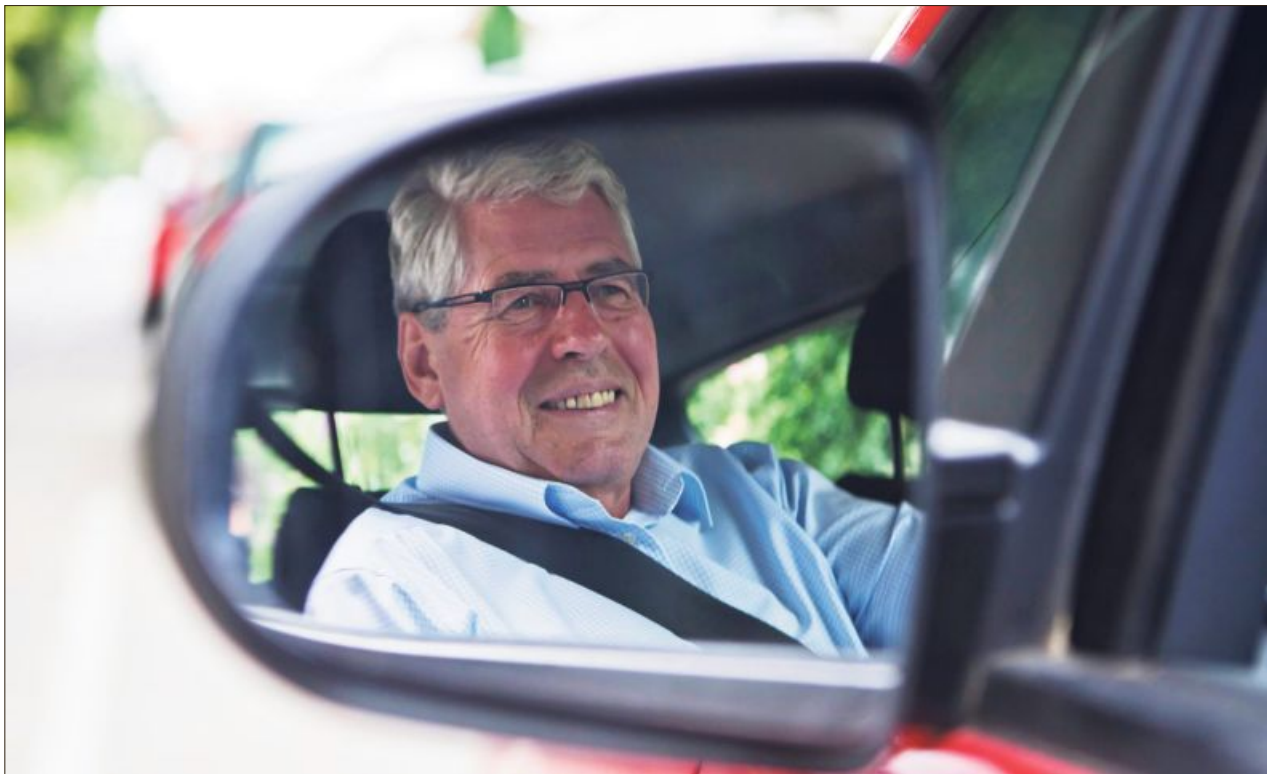
Eine freiwillige Rückmeldefahrt kann eine sinnvolle Maßnahme sein, die eigenen Fahrkünste im Alter neutral und im realen Verkehr checken zu lassen.

Damit tut sich Lucà schwer. Auch jüngere Menschen können in ihrer Fahrtauglichkeit ganz oder phasenweise – etwa bei Krankheiten – eingeschränkt sein. Allerdings lassen körperliche Fähigkeiten generell mit dem Alter nach. Aber das sei sehr, sehr individuell. „Es gibt Menschen, die sind beispielsweise mit 60 vielleicht schon nicht mehr in der Lage, gut Auto zu fahren, und andere sind mit 80 aber noch topfit, was Bewegung, Sehen und Reaktionszeit angeht“, sagt Lucà.