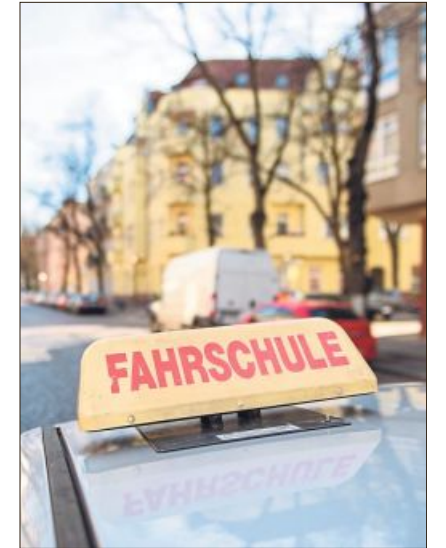
Eine freiwillige Rückmeldefahrt in einer Fahrschule kann hilfreich sein im Alter.