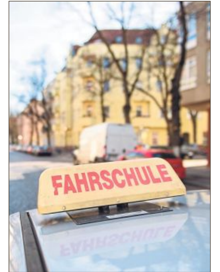
Eine freiwillige Rückmeldefahrt in einer Fahrschule kann hilfreich sein im Alter.

Redaktion Auto & Mobilität: Matthias Jell matthias.jell@mga.de